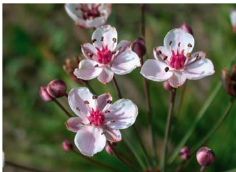
Butome en ombelle

Mais le Val d'Amour, c'est aussi des personnages célèbres (Jules Grévy, président de la 3 e République, Louis Pasteur et le berger Jupille, Edgar Faure, etc...) et toute une tradition de métiers et de savoir-faire encore très présente, sans oublier les nombreuses légendes qui font vivre notre "Val d'Amour" et qui sauront enchanter petits et grands.